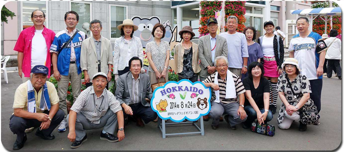
【遠軽RC親睦観戦ツアー2014】