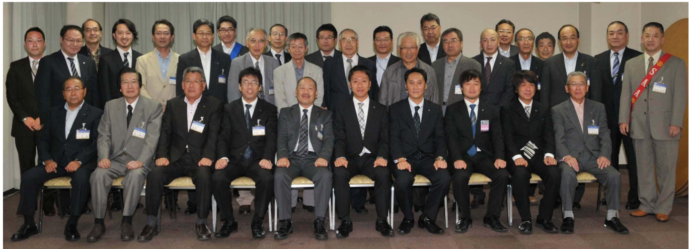
【J C と合同例会の記念撮影(一部合成)】