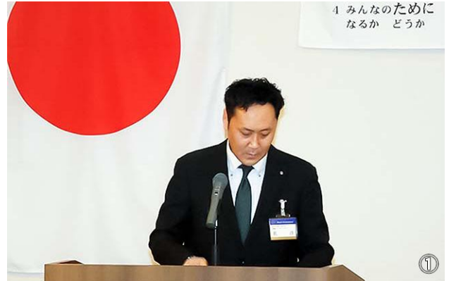
① みんなのために なるか どうか

日本のニコニコBOXは、使用用途をクラブに委任した、信頼の上に成り立っている制度であります。遠軽RCでは今年度700,000円のニコニコBOX収入を見込んでおりますので、今後も引き続き、ニコニコ笑って寄付しましょう！！麻雀大会の入賞者の皆様、本日は宜しくお願ひ致します。