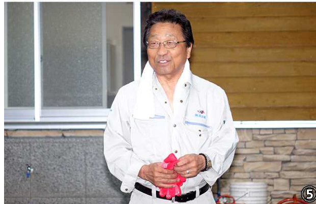
④ガバナー公式訪問例会の服装は上着着用・ノーネクタイとします。