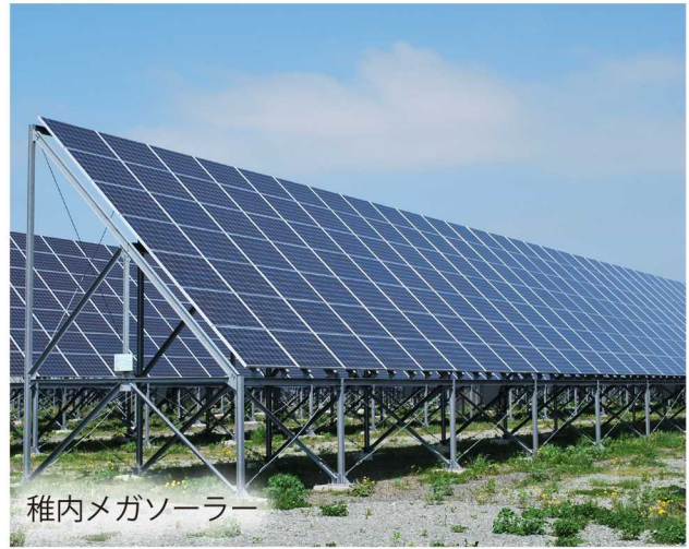
稚内メガソーラー