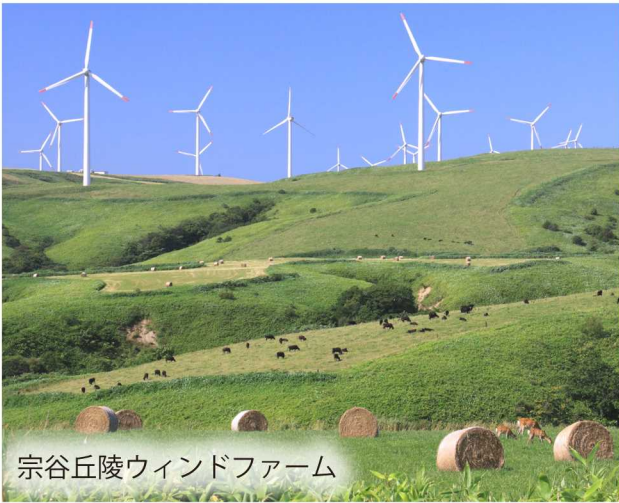
宗谷丘陵ウィンドファーム