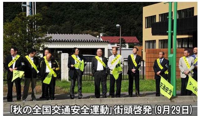
「秋の全国交通安全運動」街頭啓発(9月29日)